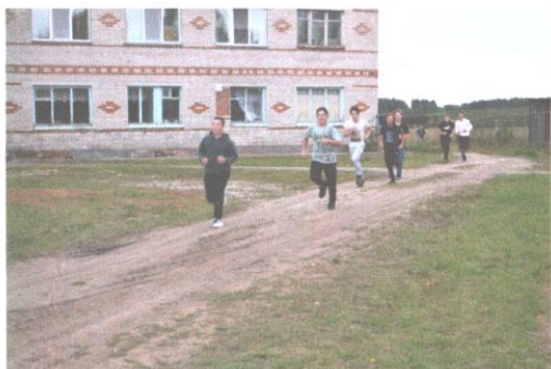
Финиш юношей старшей группы получился коллективным