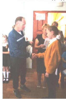
Награждение победителей Кросса наций состоялось на торжественной линейке 19 сентября