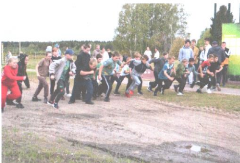
Старт средней группы – учащихся 5-7 классов