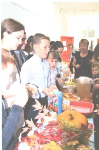
На ярмарке рады все: и продавцы и покупатели