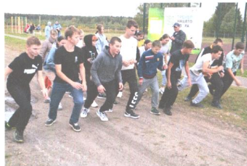
Старт группы старшеклассников – 8-9 классов