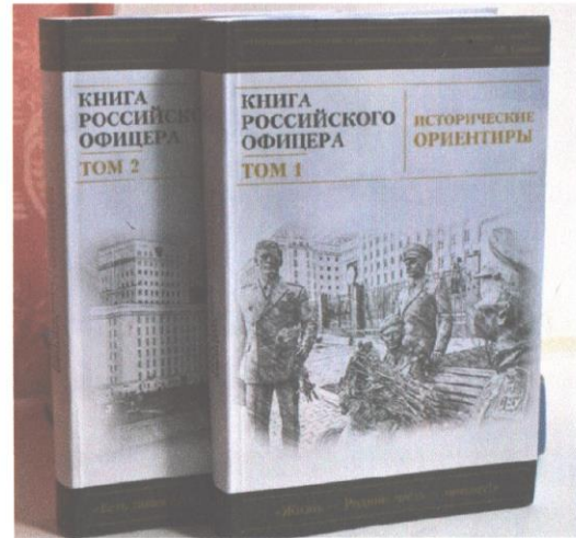
Подарок молодого офицера Красноясельской школе